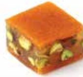
حلقوم مع قمر الدين Hazelnut Cream Item No. 4014 Dimension: Per Request