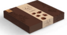
Item No. 5039 - Weight: 275g