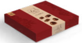
Item No. 5040 - Weight: 375g