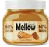
كريمة البسكويت Biscuit Spread Item No. 5022 - Weight: 200g Total Weight: 12 X 200g