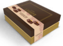
Item No. 5037 - Weight: 400g