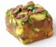
حلقوم موجه حلبي Halqom Coverd with Pstachio Item No. 11003 Dimension: Per Request