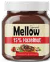
كريمة البندق و الكاكاو Hazelnut and Cocoa Spread Item No. 5021 - Weight: 350g Total Weight: 9 X 350g