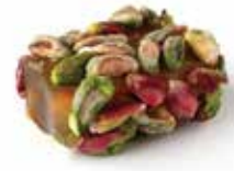
عرايشية Araishie Turkish Delight Item No. 11011 Dimension: Per Request