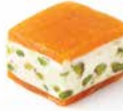
نوجا موجه حلبي Nougat Covered with Pistachio Item No. 4013 Dimension: Per Request