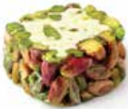
نوجا قروش Pennies Nougat Item No. 11004 Dimension: Per Request