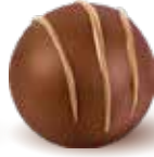
كريمة الفانيلا Vanilla Pia