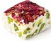
نوجا و الورد Nougat and Rose Item No. 4018 Dimension: Per Request