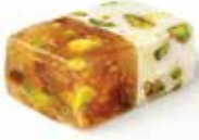
كوكتيل Cocktail Turkish Delight Item No. 4007 Dimension: Per Request