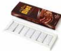
علبة سادة - شوكولاتة داكنة بدون سكر Sada-Dark Sugar Free Box Item No. 5008 - Weight: 105g (14 Pieces) Total Weight: 12 X 105g