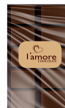
شوكولاتة داكنة Dark Chocolate Item No. 6021 - Weight: 500g Total Weight: 15 X 500g