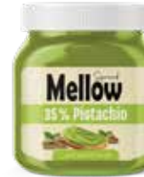
كريمة الفستق الحلبي Pistachio Spread Item No. 5025 - Weight: 350g Total Weight: 9 X 350g