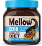
سادة - كريمة البندق و الكاكو Sada-Sugar Free Hazelnut and Cocoa Spread Item No. 5034 - Weight: 350g Total Weight: 9 X 350g