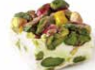
نوجا موجه حلبي Nougat Covered with Pistachio Item No. 11012 Dimension: Per Request