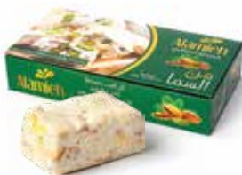
علبة من السما بالفستق الحلبي Mann and Salwa Pistachio Box Item No. 4023 - Weight: 400g Total Weight: 12 X 400g