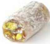
ملوكي مغرب Halqom With Sugar Item No. 4025 Dimension: Per Request