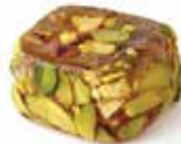
قروش الحلقوم و الحلبي Pennies Halqom with Pistachio Item No. 4009 Dimension: Per Request