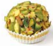
من السما Mann and Salwa Item No. 4001 Dimension: Per Request