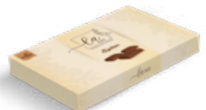
Item No. 5042 - Weight: 200g