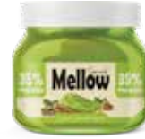
كريمة الفستق الحلبي Pistachio Spread Item No. 5024 - Weight: 200g Total Weight: 12 X 200g