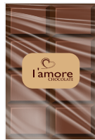
شوكولاتة بالحليب Milk Chocolate Item No. 6009 - Weight: 200g Total Weight: 20 X 250g