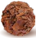
فليك Praline Flake