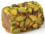
ملوكي حلبي Halqom with Pistachio Item No. 4008 Dimension: Per Request