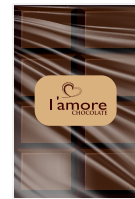
شوكولاتة داكنة Dark Chocolate Item No. 6017 - Weight: 200g Total Weight: 20 X 250g