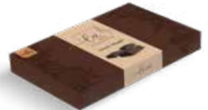
Item No. 5041 - Weight: 300g