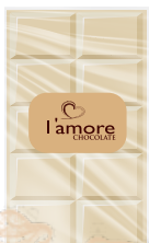
شوكولاتة بيضاء White Chocolate Item No. 6012 - Weight: 500g Total Weight: 15 X 500g