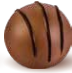
كريمة الشوكولاتة Coco Maya