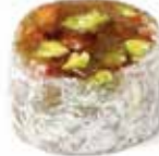
حلقوم قروش مغبرة Pennies Halqom with Sugar Item No. 4003 Dimension: Per Request