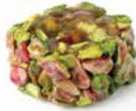
حلقوم قروش Pennies Halqom Item No. 11004 Dimension: Per Request