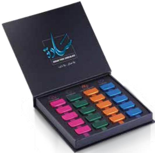
علبة سادة - شوكولاتة بدون سكر Sada-Sugar Free Box Item No. 5031 - Weight: 275g (20 Pieces) Total Weight: 12 X 275g