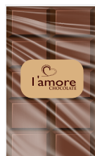
شوكولاتة بالحليب Milk Chocolate Item No. 6012 - Weight: 500g Total Weight: 15 X 500g