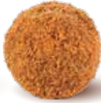
كريمة اللوتس Lotus Cream