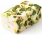
نوجا و الفستق الحلبي Nougat And Pistachio Item No. 4005 Dimension: Per Request