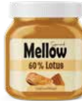
كريمة البسكويت Biscuit Spread Item No. 5023 - Weight: 350g Total Weight: 9 X 350g