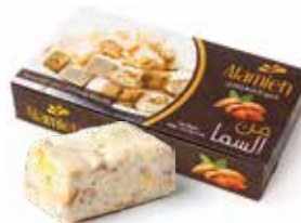
علبة من السما باللوز الشهيزوري Mann and Salwa Almond Box Item No. 4024 - Weight: 400g Total Weight: 12 X 400g