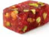
حلقوم Turkish Delight Item No. 4011 Dimension: Per Request