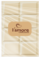
شوكولاتة بيضاء White Chocolate Item No. 6010 - Weight: 200g Total Weight: 20 X 250g