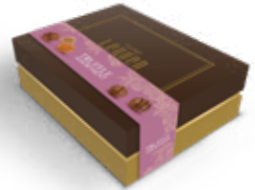
Item No. 5038 - Weight: 280g