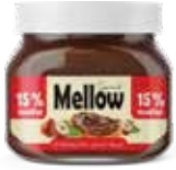
كريمة البندق و الكاكاو Hazelnut and Cocoa Spread Item No. 5020 - Weight: 200g Total Weight: 12 X 200g