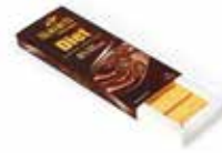
علبة سادة - شوكولاتة بدون سكر Sada-Sugar Free Box Item No. 5005 - Weight: 105g (14 Pieces) Total Weight: 12 X 105g